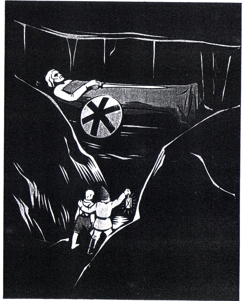
Hier lag auf einer Erhöhung ein Mensch auf dem Rücken, als ob er schlief.

Hütling löste eine Spange vom Mantel des Königs, gab sie Heiner und fuhr fort: